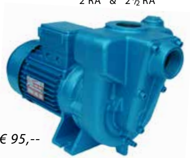
2 RA & 2 1/2 RA

Viton asafdichting, voor gasolie diesel-warmwater 90°C. meerprijs € 95,- Ook verkrijgbaar in uitvoering