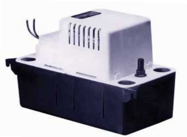
VCMA 20 S