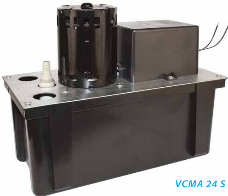
VCMA 24 S