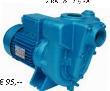
2 RA & 2 1/2 RA

Voor: Dekwaspomp - lenspomp Koelmediumpomp - bemaling Fecalienspomp - bevloeiing