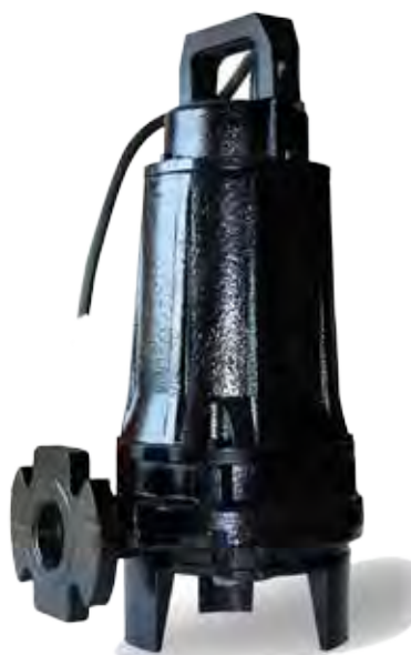
G 100 Hoogte: 400 mm Diam. 240mm