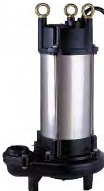
GP 212 Hoogte: 552 mm Diam. 284mm