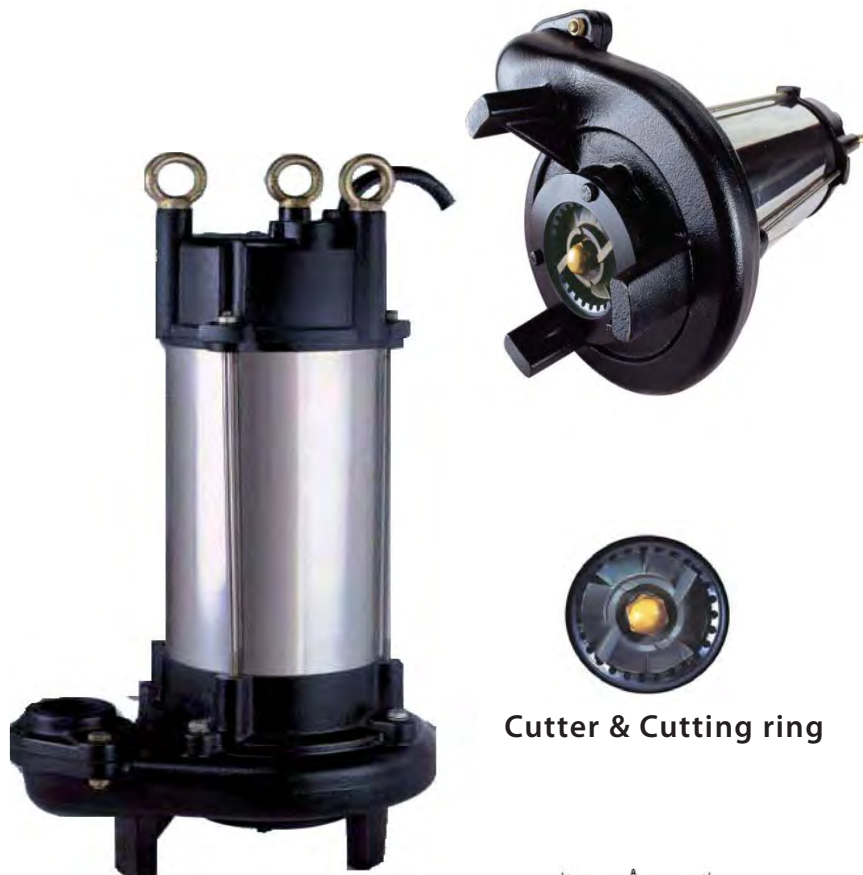
Cutter & Cutting ring